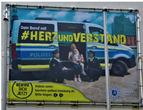
Banner Polizeiwache Wiesendamm

Auf Grund der Verordnungen der Stadt Hamburg zur Eindämmung des Corona Virus bitten wir um Ihre Anmeldung . Begrenzte Teilnehmerzahl!